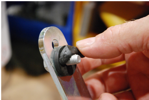
Kulissenstein mit Abstandsblech unten