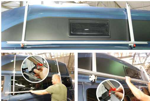
Kulissenstein mit Winkelhalter oben

www.westfalia-mobil.de infoservice@westfalia-mobil.de